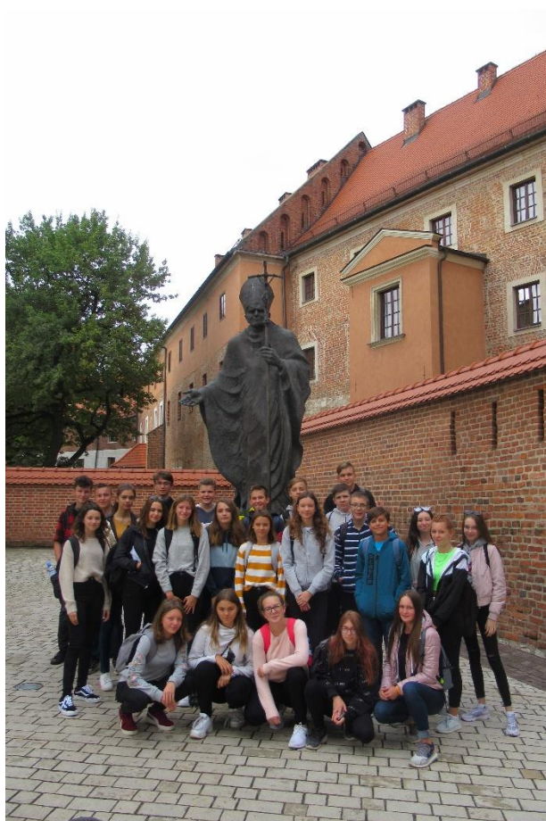
(školní zájezd Polsko – Wawel, Krakow)