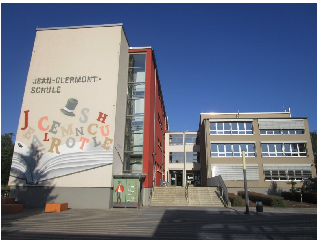
(základní škola v partnerském městě Oranienburg)

Udržujeme pravidelný kontakt s německou partnerskou školou Jean-Clermont-Schule v Oranienburgu. Pravidelný výměnný pobyt žáků se neuskutečnil s ohledem na mimořádné opatření Ministerstva zdravotnictví ČR v souvislosti s Covid19. Na podzim strávila skupina 5 pedagogů týden na odborné stáži v Oranienburgu.