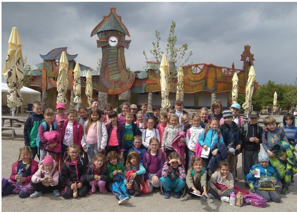
(výlet do zábavního parku)