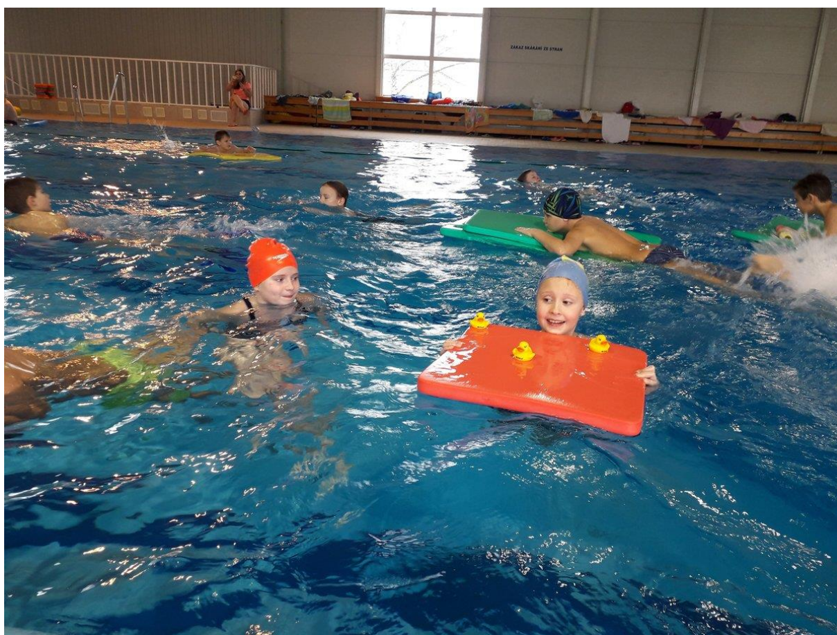
(plavecký kurz 2. ročník)

Sportovní profilace se odráží v následujících pravidelně organizovaných aktivitách: lyžařský kurz, sportovní kurz Slapy, zimní (lyžování) a letní (turistika, plavání, míčové hry) sportovní kurzy. V 1. a 2. ročníku absolvují žáci plavecký kurz. Dle zájmu zákonných zástupců žáků 1. stupně je do tělesné výchovy zařazena i výuka bruslení. Volnočasové aktivity v odpoledních hodinách se zaměřují také na sport – stolní tenis, cyklistika, basketbal apod. Žáci se zúčastňují mnoha sportovních týmových i individuálních soutěží. Jsme zapojeni do projektu Sportuj ve škole, díky kterému mohou žáci prvního stupně využít zdarma hodinu tělesné výchovy navíc v průběhu odpoledního provozu školní družiny.