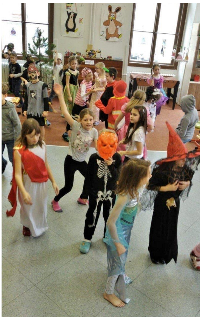
(karneval ve školní družině)