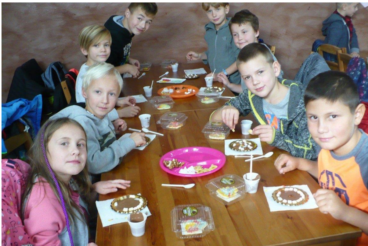
(projektový den v čokoládovně)

Projektové dny školní družiny a školního klubu ve škole i mimo školu – setkání se zajímavými osobnostmi z různých oborů