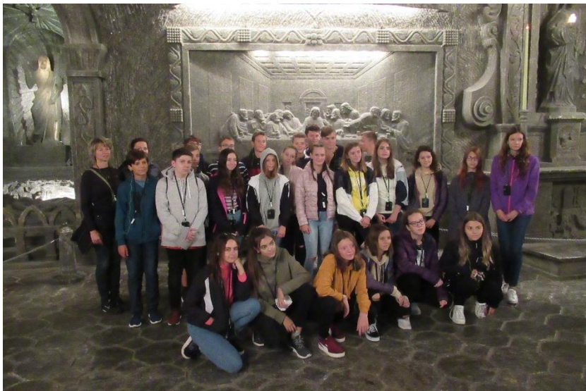
(školní zájezd Polsko – Wieliczka)

Udržujeme pravidelný kontakt s německou partnerskou školou Jean-Clermont-Schule v Oranienburgu. Pravidelný výměnný pobyt žáků se neuskutečnil s ohledem na mimořádné opatření Ministerstva zdravotnictví ČR v souvislosti s Covid19. Na podzim strávila skupina 5 pedagogů týden na odborné stáži v Oranienburgu.