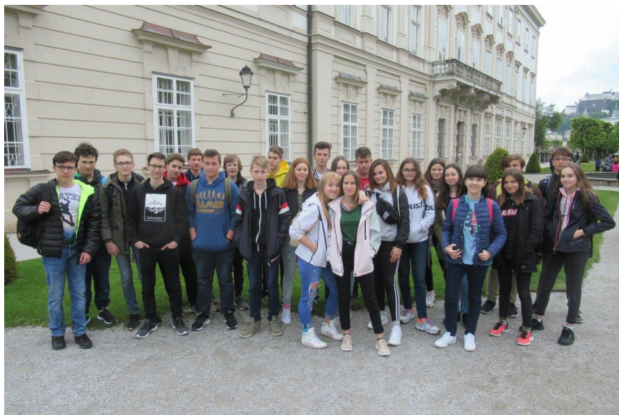
(školní zájezd Rakousko – Salzburg)

(Krakov, Osvětim, Wieliczka) a dále zájezd do Rakouska a Německa (Salzburg, Mauthausen, Orlí hnízdo v Berchtesgaden).