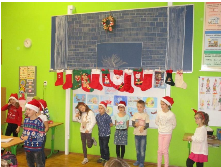
(projektový den Vánoce ve světě)