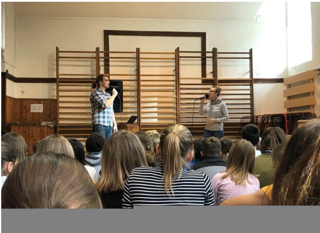
(koncert pro radost)