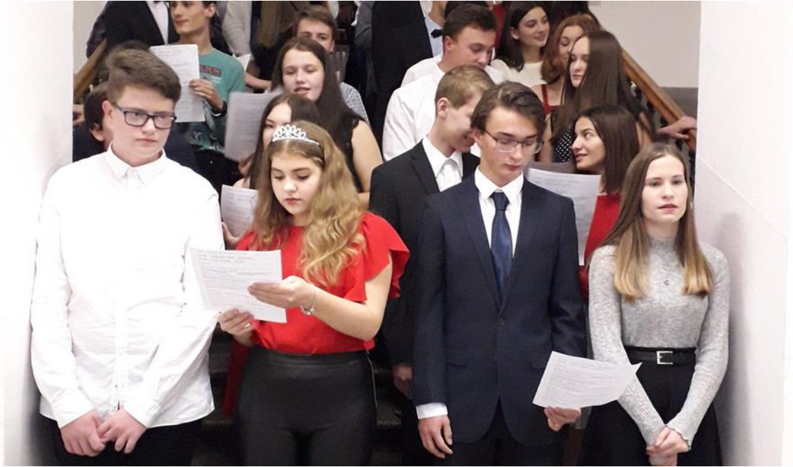
(vánoční koncert na schodech)