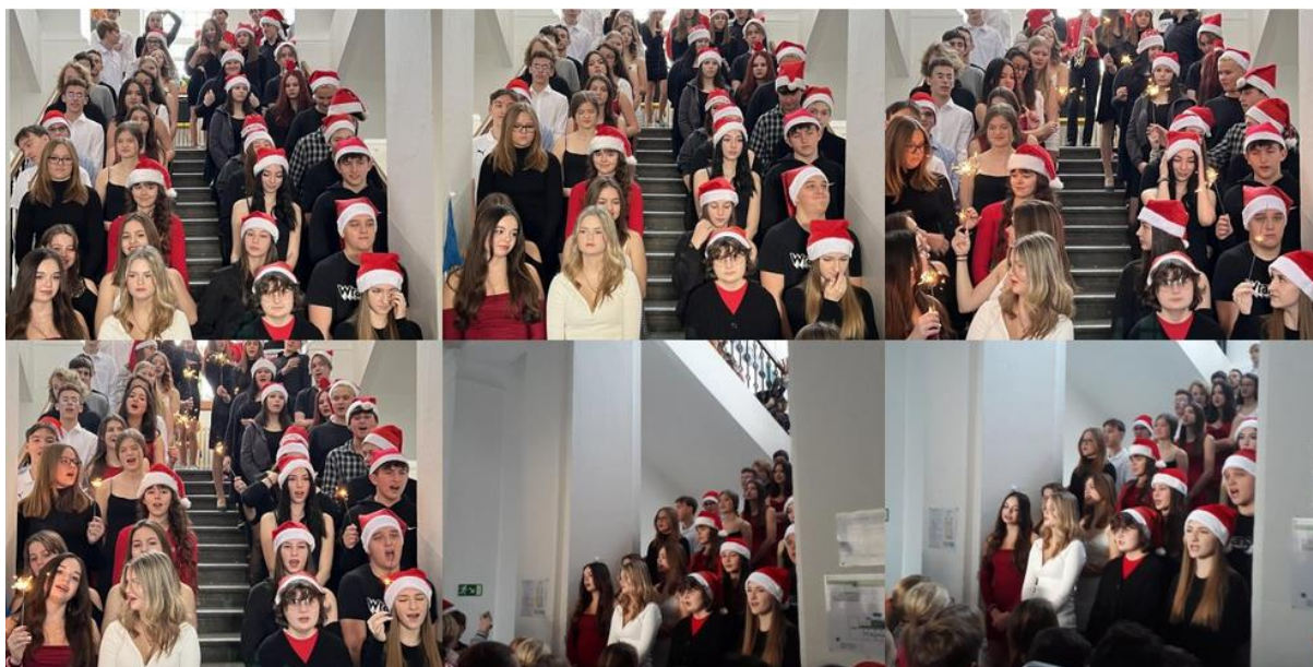
Vánoční projektový den – koncert na schodech