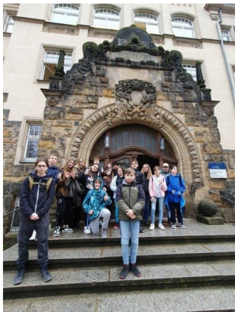
Výměnný pobyt žáků - Löbnitzgymnasium Radebeul

Nově jsme zpracovali vzdělávací program přípravné třídy, který byl zpracován dle Rámcového vzdělávacího programu pro předškolní vzdělávání. Primárním cílem vzdělávání v přípravné třídě je poskytnout dítěti individuální pomoc v oblasti, ve které nyní selhává, připravit ho na bezproblémový nástup do 1. třídy v následujícím školním roce. Dále chceme dítě připravit na zvládnutí každodenních činností využíváním účinných metod a forem práce s ohledem na jeho potřeby (vyvážený poměr spontánních a řízených aktivit, preference hravé a tvořivé činnosti, podpora dětské zvědavosti apod.). Dalším cílem je všestranný a harmonický rozvoj dítěte, rozvíjení jeho fyzických, psychických i sociálních schopností a dovedností, zdravých životních návyků a postojů jako základů zdravého životního stylu. Děti jsou vedeny k samostatnosti, k posilování sebevědomí a k prodlužování záměrné pozornosti. Prioritou je rovněž podporovat