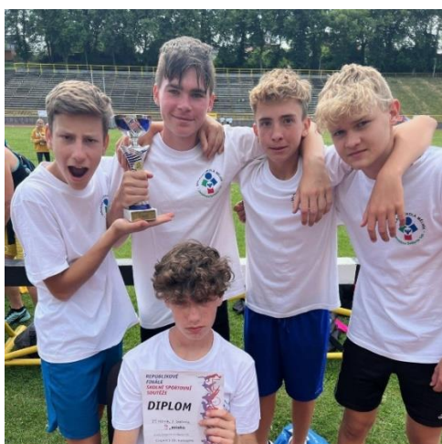
Republikové kolo atletického čtyřboje v Opavě