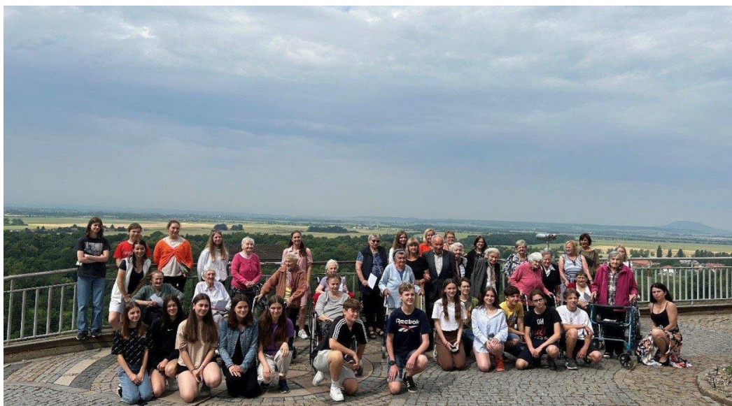
Komentovaná prohlídka města zorganizovaná žáky IX. A pro Centrum seniorů Mělník

Prezentace školy na veřejnosti probíhá prostřednictvím webových stránek, příspěvků do místního tisku, především do měsíčníku Radnice, který vydává MÚ Mělník a který je distribuován do všech domácností města Mělník. Pořádáme také akce pro zákonné zástupce žáků i širší veřejnost – koncerty, vystoupení, výstavy, besedy s osobnostmi. Aktivně se zapojujeme do dobročinných a dobrovolnických akcí – úklid veřejných prostor, humanitární sbírky apod.