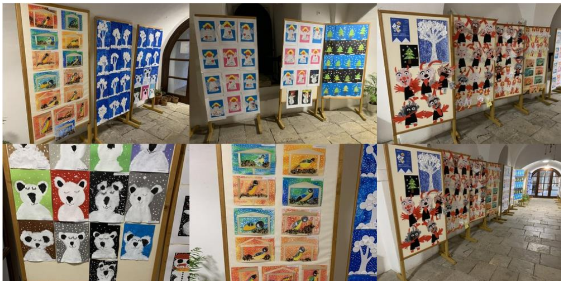
Vánoční výstava výtvarných prací žáků I. B v Regionálním muzeu Mělník