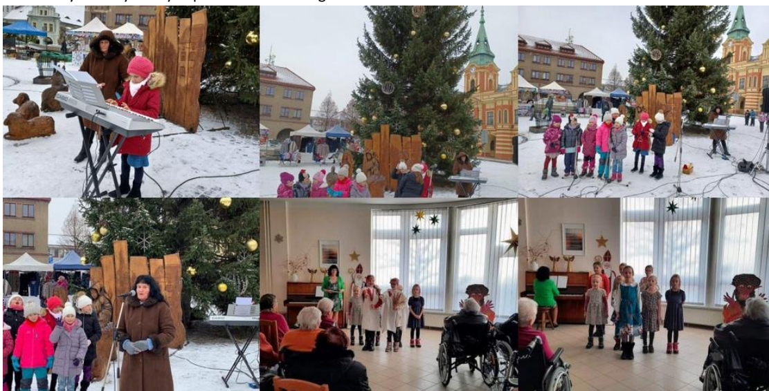
Vystoupení žáků školy na vánočních trzích na náměstí Míru a v Centru seniorů Mělník

Při plnění úkolů ve vzdělávání spolupracujeme s následujícími organizacemi: