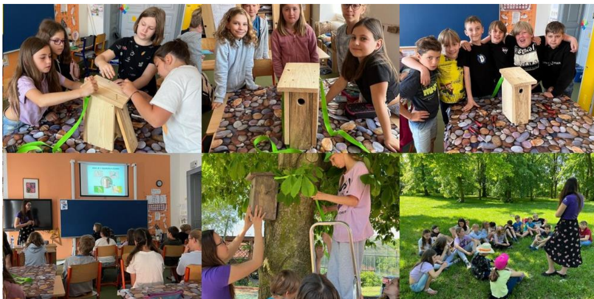
Projekt ptačí budky

Vyučující zařazují do výuky miniprojekty na různá aktuální a zajímavá témata, v některých třídách 1. stupně jsou realizována centra aktivit. Školní žákovský parlament organizuje tematické dny a projektové dny.