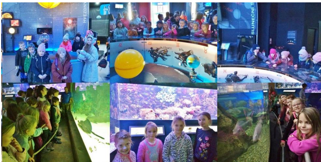
Výlet školní družiny Planetarium Praha a Mořský svět Praha