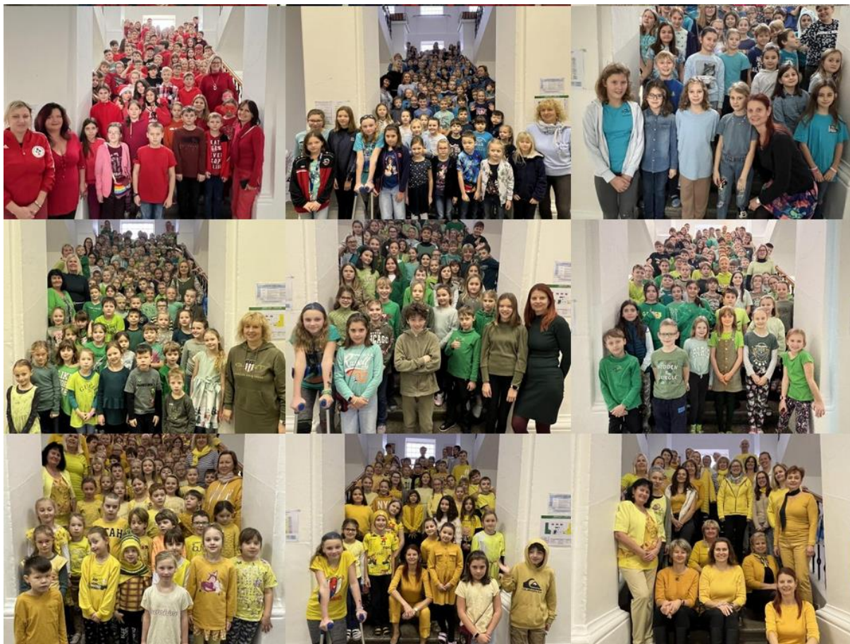
Tematické dny školního parlamentu - Barevný týden na Seifertce