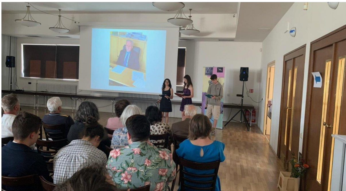
Projekt Příběhy našich sousedů