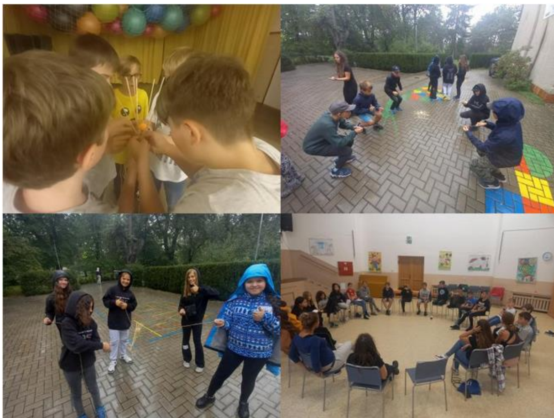
Miniadaptační kurz 6. tříd