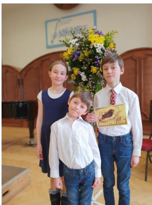
Karlovarský skřivánek – celonárodní kolo